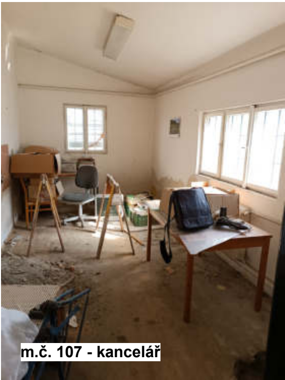
m.č. 107 - kancelář