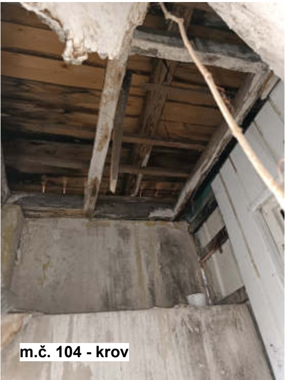
m.č. 104 - krov