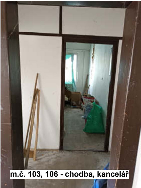
m.č. 103, 106 - chodba, kancelář