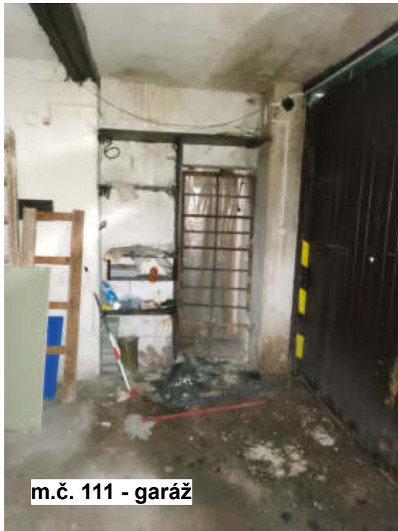
m.č. 111 - garáž