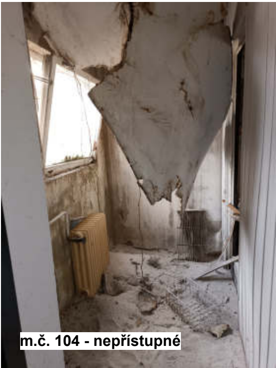
m.č. 104 - nepřístupné