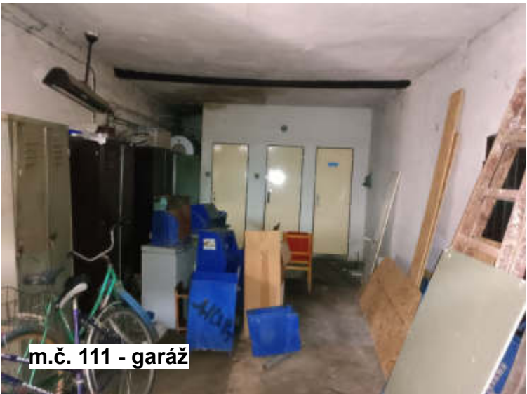
m.č. 111 - garáž