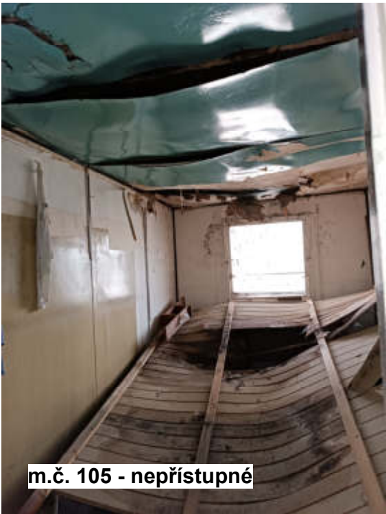
m.č. 105 - nepřístupné