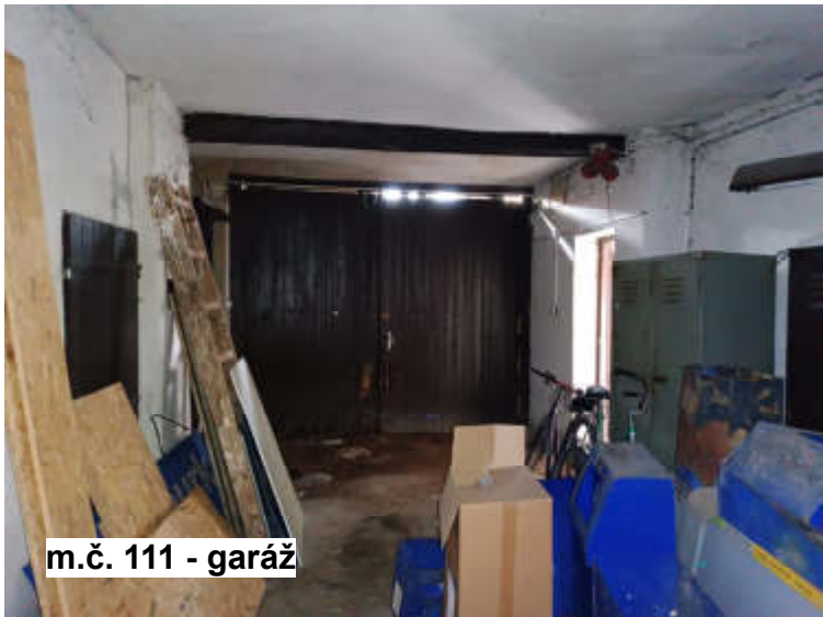
m.č. 111 - garáž