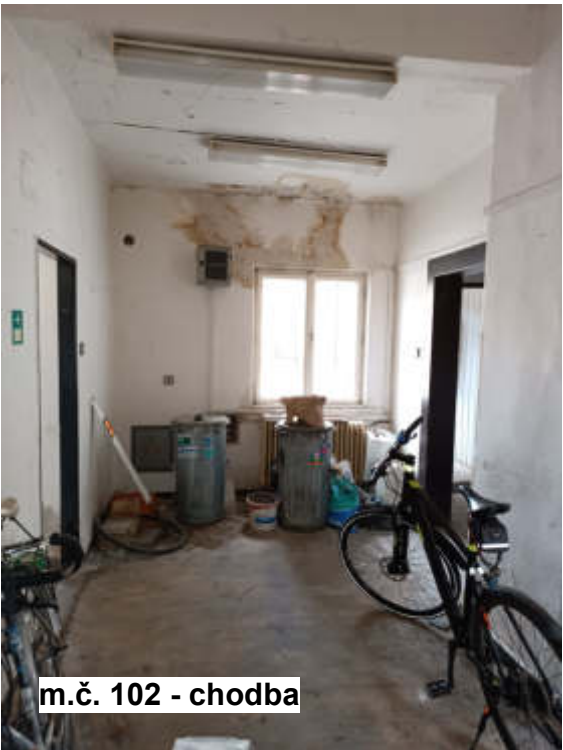
m.č. 102 - chodba